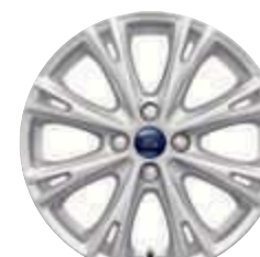
Jantes de liga em Sparkle Silver de 17" (opção)