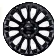
Jantes de liga leve pintadas em preto de 16" (de série)

Fiesta ST-Line Red & Black (Vermelho) com jantes de liga leve pintadas em preto de 17" (opção) Fiesta ST-Line Red & Black (Preto) com jantes de liga leve pintadas em preto de 17" (opção)