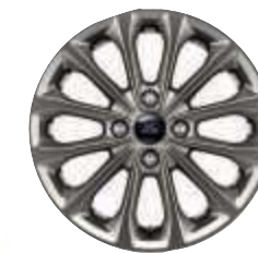
Jantes de liga leve em Rock Metallic de 16" (de série)

1 A Assistência de emergência da Ford é uma característica inovadora do SYNC que utiliza um telemóvel ligado e emparelhado com Bluetooth® para ajudar os ocupantes do veículo a iniciarem uma chamada directa para o Centro de comunicações local, na sequência de uma colisão do veículo envolvendo o accionamento do airbag ou do interruptor para desligar a bomba de combustível. Esta característica está disponível em mais de 40 países e regiões da Europa.