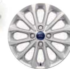
Jantes de liga leve de 16" (opção)