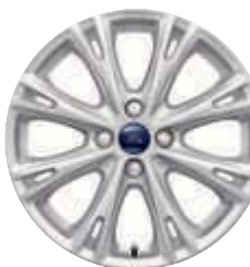
Jantes de liga em Sparkle Silver de 17" (opção)